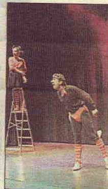
Sobre estas líneas, tres momentos del espectáculo «Jarabe de risa», que tuvo lugar ayer en el Teatro del Mar y que se repitió por la tarde en el Teatro de Manacor.