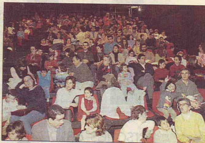
Mucho público y poca espacio. La convocatoria tuvo una gran respuesta de público y dejó el Teatro del Mar pequeño, quedando mucha gente en la calle, sin poder entrar. Para próximas ediciones debería pensarse en buscar un teatro más grande para que todos los interesados tuvieran la oportunidad de asistir.