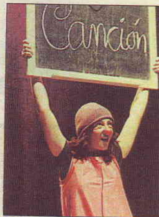
Benéfico. El objetivo de estos espectáculos, además de divertir al público y dar a conocer a Sonrisa Médica, es recaudar fondos para esta asociación que ayuda a los niños enfermos a sonreír.